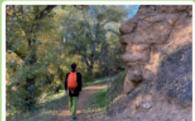
Junto al Henares