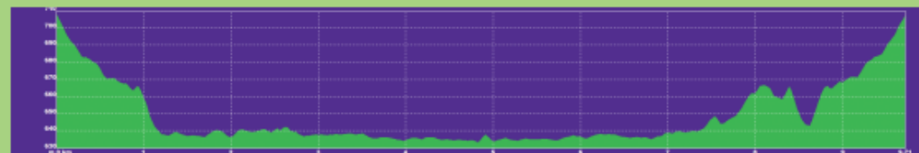
Perfil ruta de la Ciudad de la Raqueta a la fábrica de harinas Mora (Los Manantiales) (9,700 km)