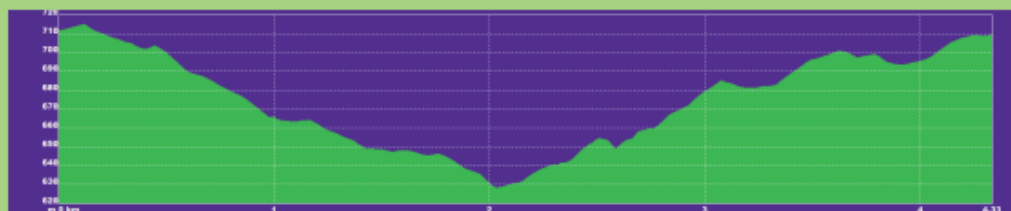
Perfil ruta Por el arroyo de la Huerta de la Limpia (4,300 km)