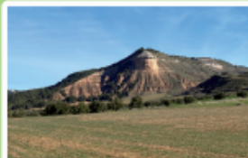
La Peña Nueva