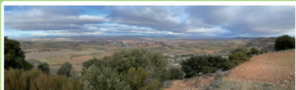
Guadalajara desde el Cerro de San Cristóbal