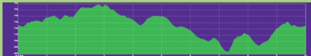
Perfil ruta por los caminos de Taracena (10,000 km)